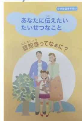
小学校低学年向け

各種 1冊 300円 2種類 1セット 500円 でご購入いただけます。 (送料・手数料別途がかかります)